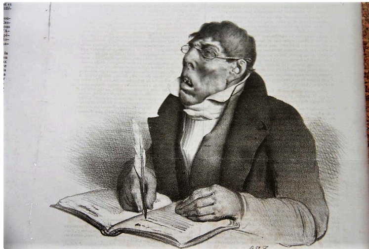
L'art de la caricature et la liberté d'expression au Lycée Bossuet