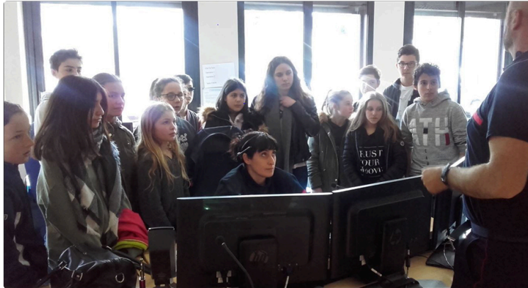
A la découverte du centre d'alerte

Les cadets du collège d'Aignan en visite