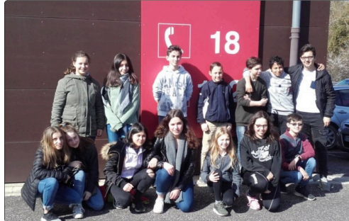
pompiers college aignan2.JPG

Le SDIS 32 accompagne trois classes de cadets de la sécurité civile. Aux côtés des collégiens d'Aignan, les lycéens de Saint-Christophe à Masseube et du Garros à Auch sont ainsi formés au PSC1 (prévention et secours civiques de niveau 1), apprennent à s'intégrer au PPMS (plan particulier de mise en sûreté) de leur établissement et découvrent l'organisation des sapeurs-pompiers.