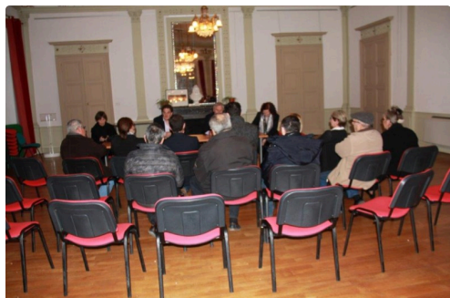
une partie de l'assistance