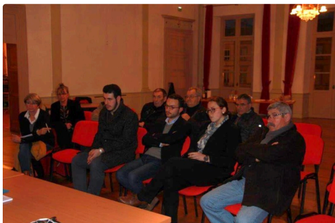
une écoute attentive et des questions