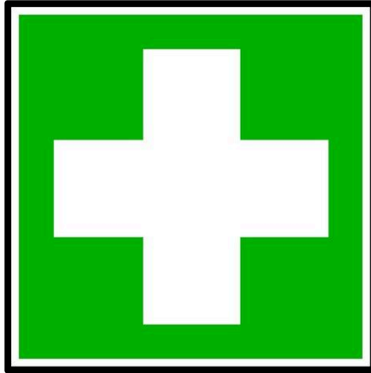
problème alerte thyroïde

Communiqué de presse de Me Colin-Chauley