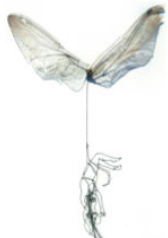
Diverses phases BORBORYGMES

Pour une charte du Spectacle vivant en direction du Jeune Public.