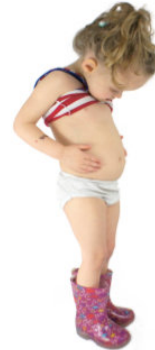
Diverses phases BORBORYGMES