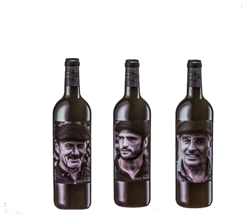
Plaimont Producteurs s'adapte au marché

Un nouveau plan d'entreprise est en chantier