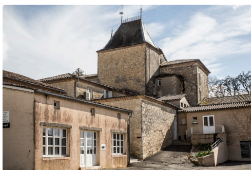
Le château de Mons où a eu lieu l'assemblée générale