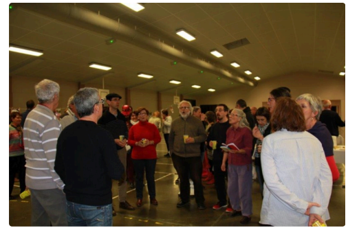
Chanteurs et Chanteuses de Gascogne