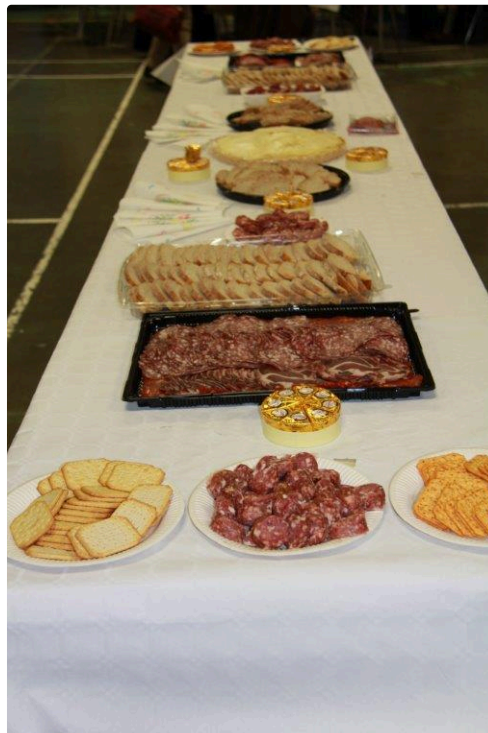
pour accompagner l'apéritif