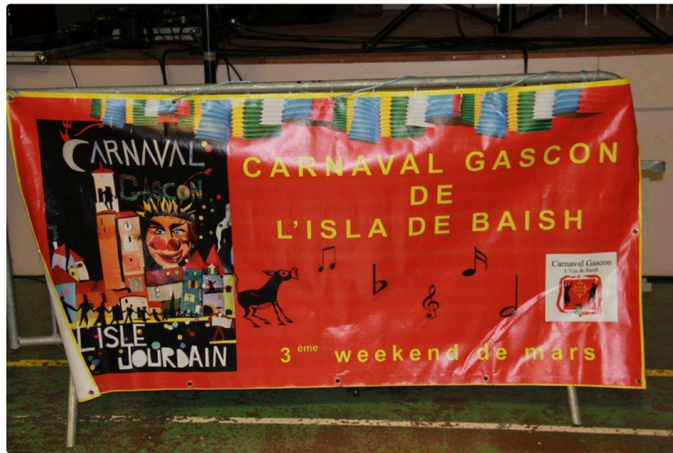
soirée des vingt ans du carnaval gascon

Et pour la fin des festivités carnavalesques une soirée réussie