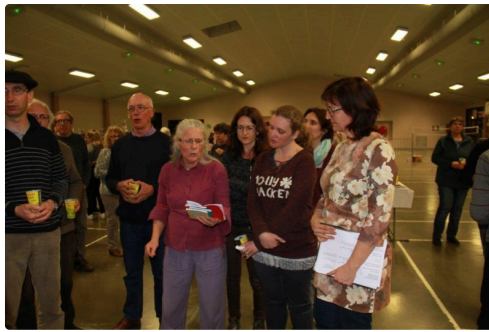
Chanteurs et Chanteuses de Gascogne