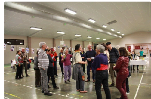
une soirée bien conviviale