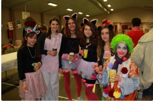
des jeunes filles pour la photo