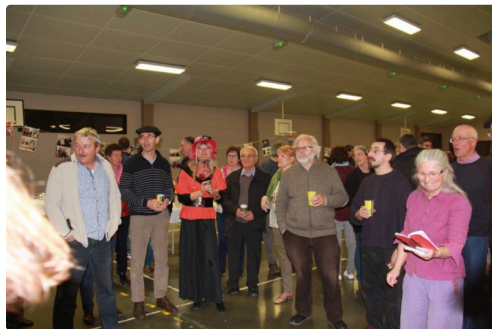
une soirée bien conviviale

Belle réussite pour cette soirée anniversaire de clôture de l'édition 2018 du carnaval gascon.