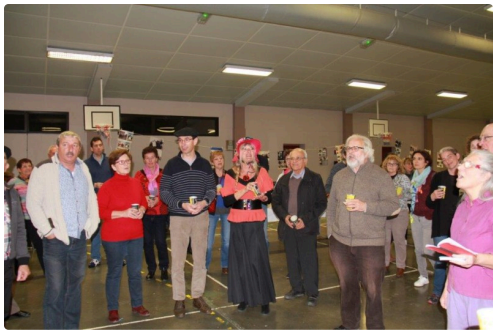
Chanteurs et Chanteuses de Gascogne