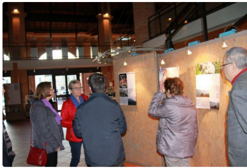
visiteurs de l'exposition