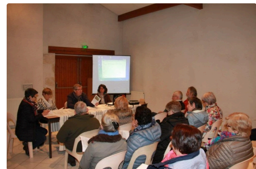
Une vingtaine d'adhérents ont assisté à l'assemblée générale.