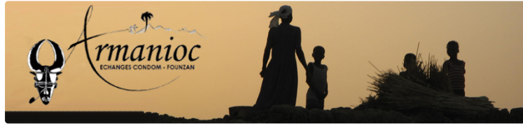
Armanioc : Après d'intenses activités en France et au Burkina-Faso l'association se met en sommeil