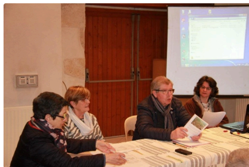
Le bureau d'Armanioc lors de l'assemblée générale.