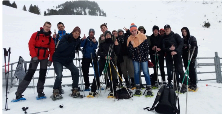
Le lycée Beaulieu à l'heure européenne

Du 4 au 18 mars, le lycée Beaulieu Lavacant accueille 14 étudiants anglais du North Shropshire College et 6 étudiants tchèques du lycée de Znojmo dans le cadre d'Erasmus Plus enseignement professionnel. Tous originaires de région rurale à l'ouest de Birmingham ou au sud ouest de la République Tchèque, ils découvrent le Gers lors d'un stage de deux semaines en restauration et service pour les anglais, en exploitation agricole pour les tchèques.