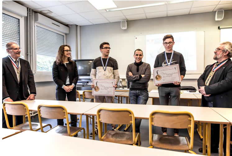
Nogaro - Des gagnants au concours des Meilleurs apprentis de France

La Société nationale des Meilleurs ouvriers de France (SNMOF) organise chaque année le Concours des Meilleurs apprentis de France. La section professionnelle du lycée polyvalent d'Artagnan y participe.