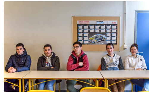
Les futurs candidats