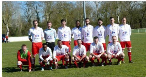
L'équipe d'Auch avant le match.