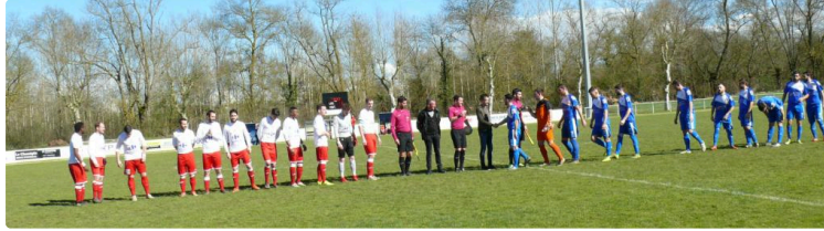
Football division honneur : Auch s'impose à Fleurance

Ce derby qui ne restera pas dans les annales revient logiquement aux auscitains