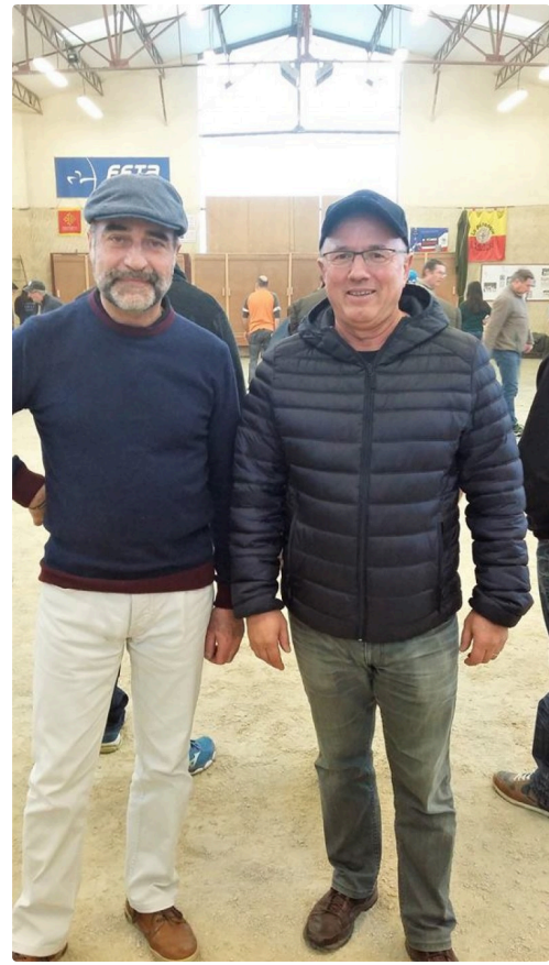
Deux animateurs dont le président