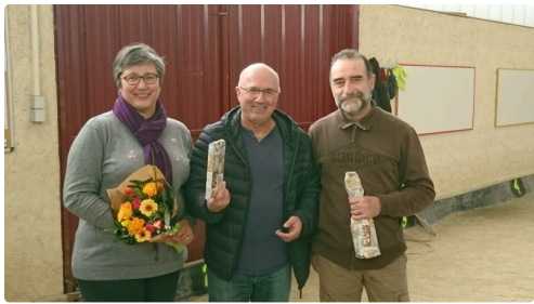
la pétanque lilloise