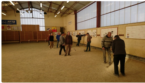
la pétanque lilloise en action