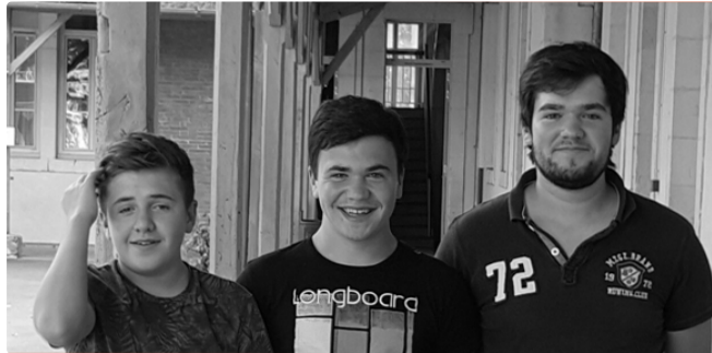
MIRANDE Ecole de musique

Bons prof's, bons élèves, les résultats sont là