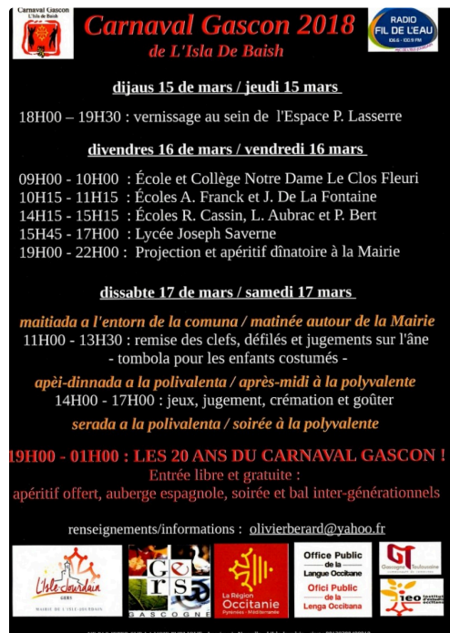
programme du carnaval