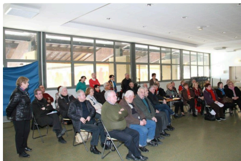
Vue de l'assemblée.