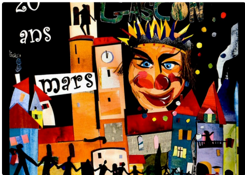
affiche du carnaval de mars 2018