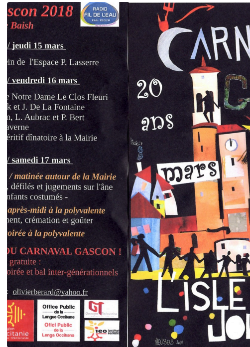
Carnaval Gascon et programme