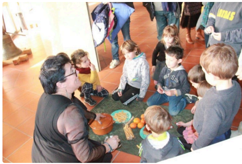
le goûter bien mérité de "Grignoti-Grignota"