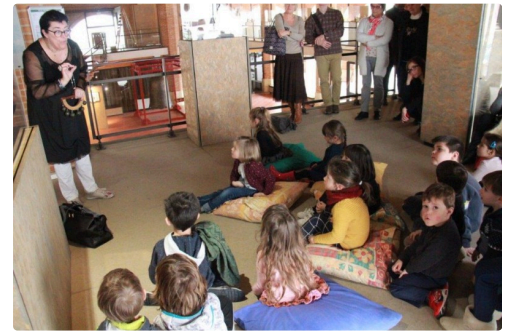
une écoute admirative