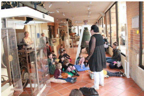
des contes dans un cadre enchanteur