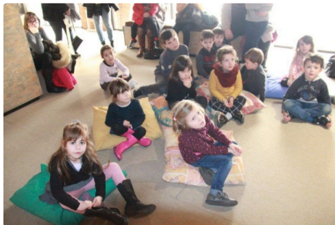
enfants super attentifs