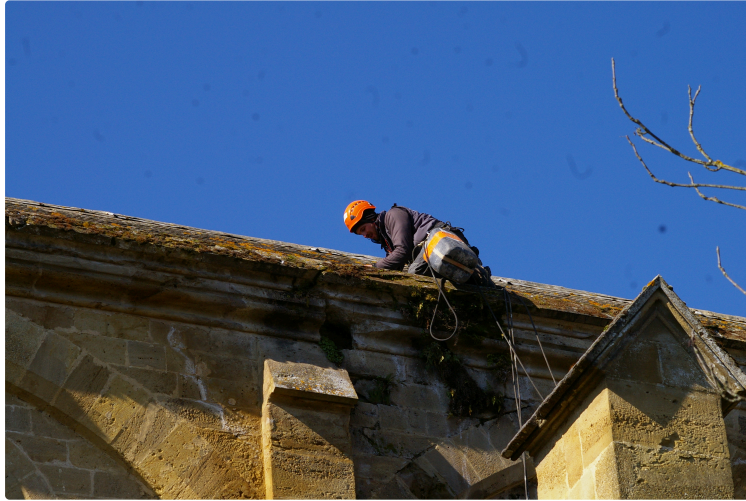
Dévégetalisation de l'église

Trois jeunes "cascadeurs" d'une entreprise Bigourdane spécialisée dans les travaux d'édifices travaillent sur le toit de l'église de Plaisance.