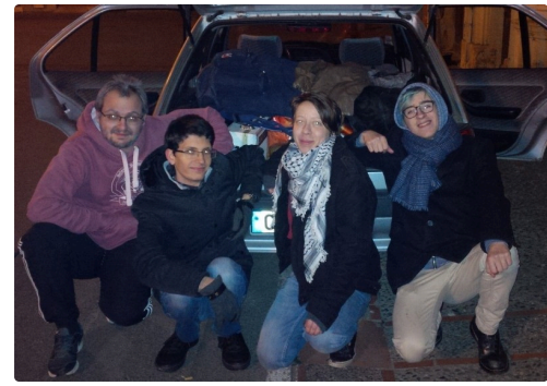
tournage à la maison Claude Augé