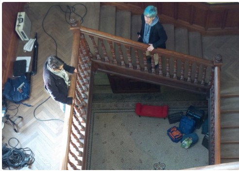
tournage à la maison Claude Augé