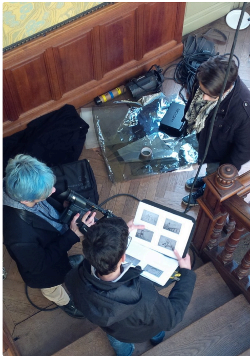
tournage à la maison Claude Augé