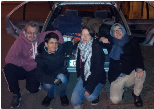
tournage à la maison Claude Augé