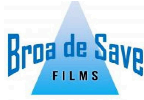
tournage par des étudiants de l'Ensav et "Broa de Save"