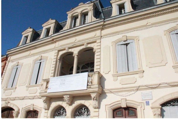
Tournage d'un film à la Maison Claude Augé

La pesta blua, par des étudiants de l'Ensav et "Broa de Save"