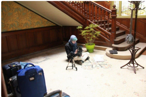
tournage à la maison Claude Augé