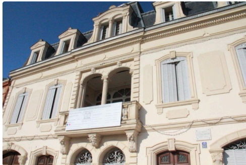
la magnifique maison Claude Augé, lieu du tournage