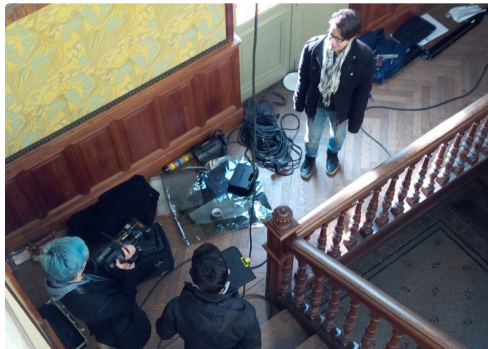
tournage à la maison Claude Augé