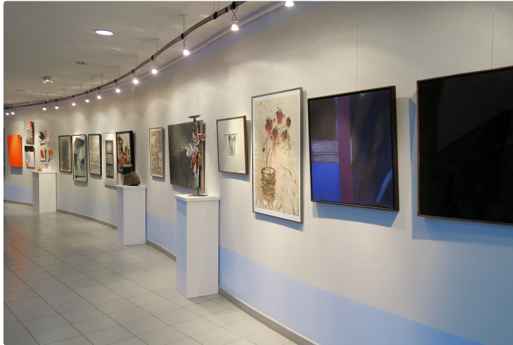
Les Vingt Ans de la Galerie Bleue

En 20 ans, la Galerie Bleue, a accroché 60 expositions qui ont concerné 61 artistes.