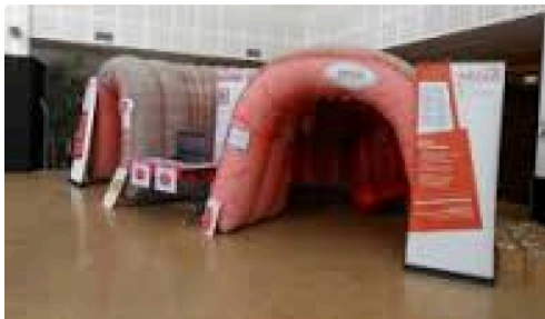
Structure gonflable intérieur du colon

De 9h à 19h, le public pourra visiter cette structure gonflable représentant l'intérieur du colon. La Ligue et ses partenaires (médecins de l'Association de Dépistage des Cancers Gersois) proposent une information ludique et pédagogique pour mieux appréhender les techniques de dépistage et les traitements.