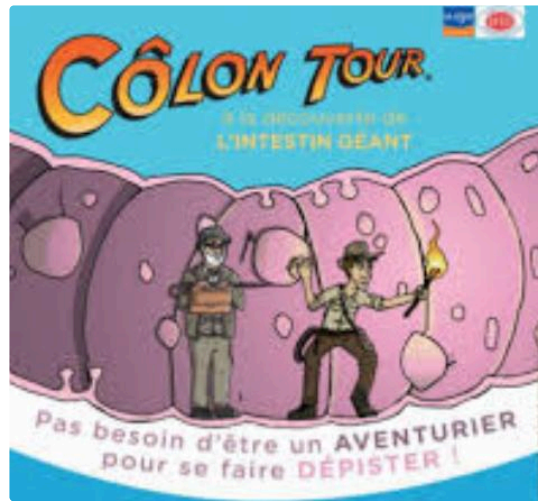
Depistage Cancer colo rectal mars bleu « Colon Tour »

Pour la quatrième année consécutive, le Comité du Gers de la Ligue Contre le Cancer, avec le soutien de la Mutualité Française, de l'ADGC (Association Dépistage des Cancers), de la CPAM et de la MSA, fait venir le « CÔLON TOUR » à la galerie marchande du Centre Leclerc le jeudi 1er et vendredi 2 mars 2018.