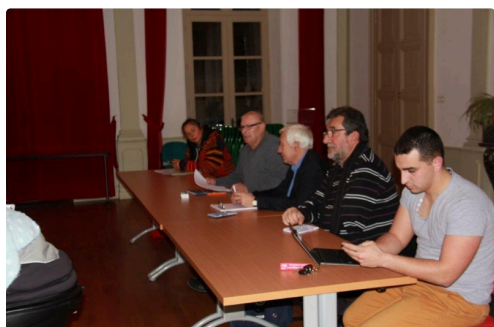
bureau et élus