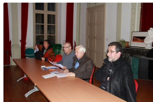
bureau et élus