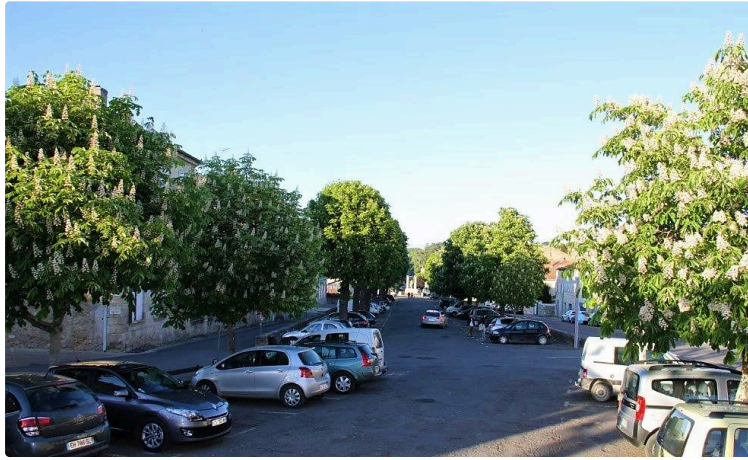
Lancement des travaux d'aménagement des Promenades et des Places de la Liberté et du Souvenir

Gérard Dubrac a présenté hier lors d'une conférence de presse les travaux d'aménagement prévus à Condom.