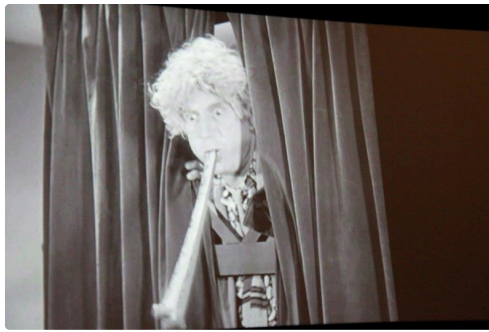
Harpo Marx, dans le premier film présenté