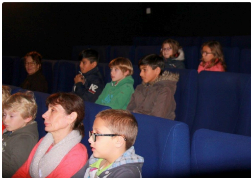
un jeune public attentif, très cultivé et très participatif