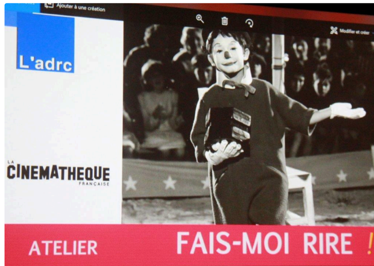
Atelier "fais moi rire"

Ce mercredi 21 février, dans l'après-midi d'une de ces journées de vacances scolaires, un atelier très intéressant pour les jeunes, et les moins jeunes, avides de culture cinématographique, se tenait au Cinéma Olympia .