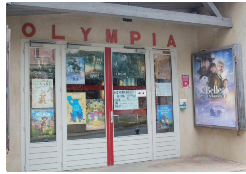
le cinéma Olympia