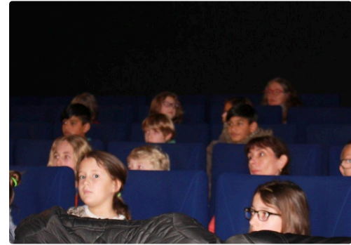
un jeune public averti