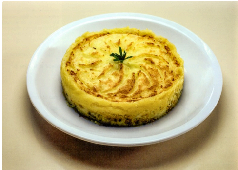
Brandade parmentière