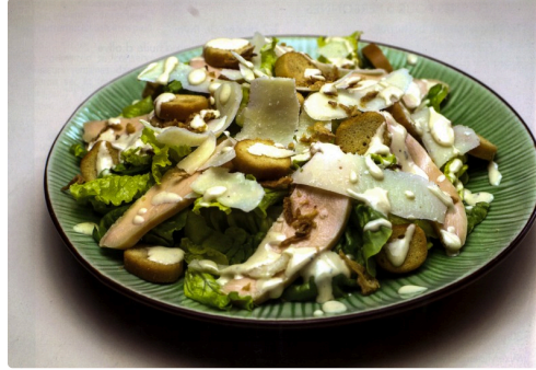
Salade Caesar au poulet