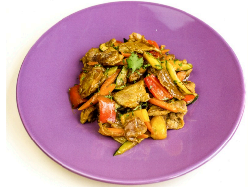
Émincé de porc à la vietnamienne