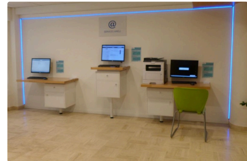
L'espace libre service