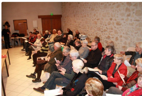
Une trentaine de personnes ont assisté à l'assemblée générale.