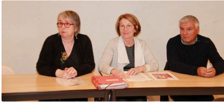
Activité artistique très soutenue chez " les Amis de Saint-Michel"