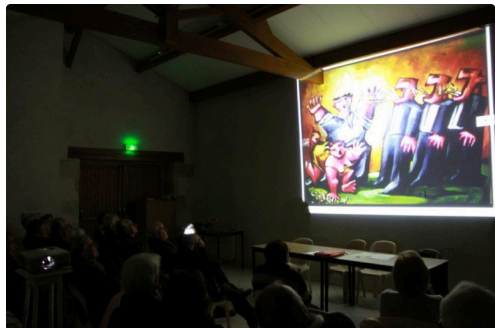
Présentation des artistes 2018.