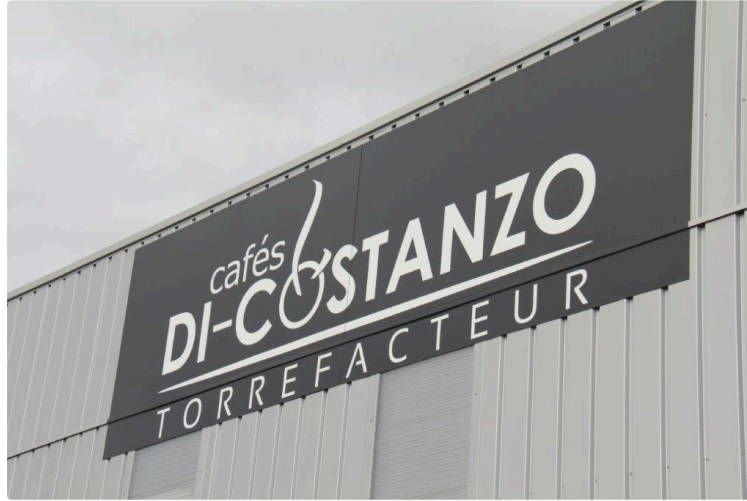
Les Cafés Di-Costanzo à l'honneur

A la suite de la parution du classement de la croissance des 500 entreprises les plus dynamiques au plan national, dans les Echos du 10 février 2018, pour la brillante entreprise gersoise "les Cafés Di-Costanzo", dirigée par les époux Gavanier, nous avons été reçus ce jeudi 15 février, par Emilie Gavanier.