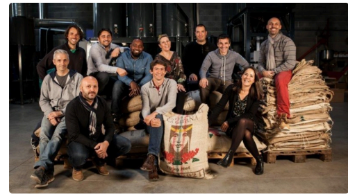
l'équipe Di-Costanzo