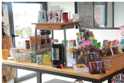
les produits présentés à la boutique