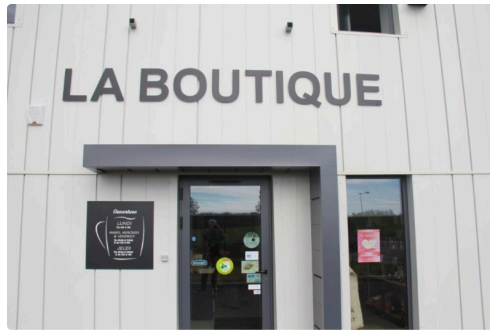
la boutique du Pont Peyrin