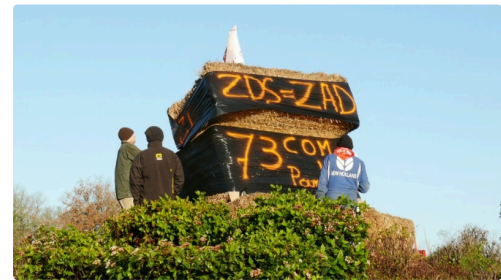
Mise en place des banderoles.