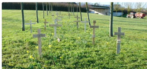
Des croix au rond point des Justes représentant les communes exclues des zones défavorisées.