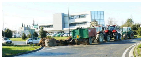
Rond point des Justes.