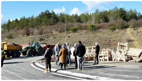
Rond point de St Cricq.