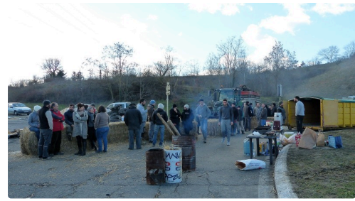
Rond point de Pavie, on se réchauffe .