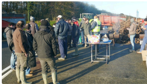
Les manifestants au rond point de la Hurée.

voir la vidéo de Stéphane Zanchetta et Clément Souques de la FDSEA .