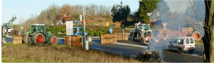
Paralyse des grands axes routiers menant sur Auch

Une opération menée par la FDSEA 32 et JA 32 pour faire pression sur le gouvernement et obtenir le classement des 74 communes en zones défavorisées