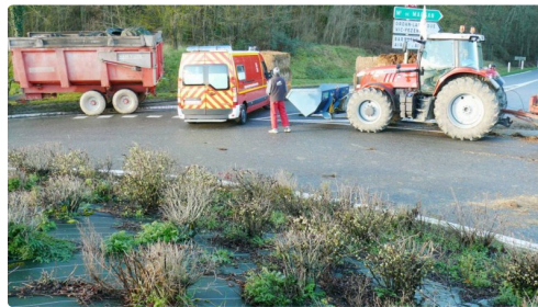
Brèche ouverte pour les pompiers.