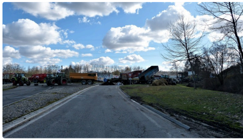
Rond point de Pavie.