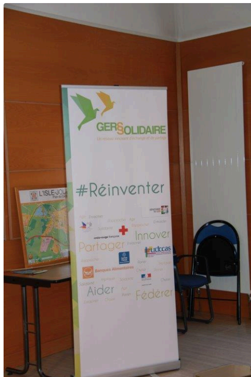
Le Gers solidaire