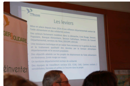
les thèmes expliqués