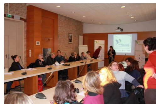
Avant le début des discussions