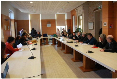
l'ouverture de la conférence Gers Solidaire