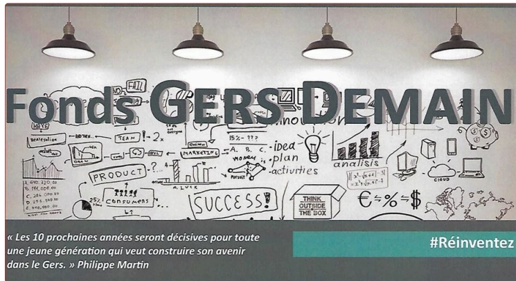
FONDS Gers Demain