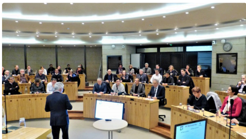
L'assistance : élus et chefs d'entreprises.