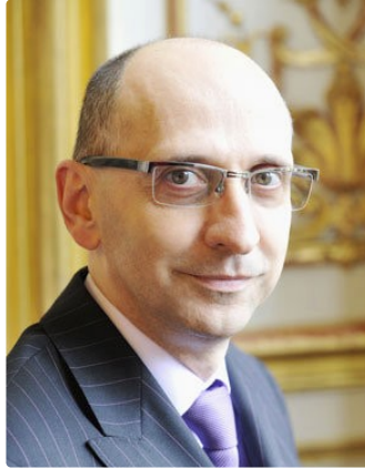
Le mot de Gilles / une gauche réduite et isolée