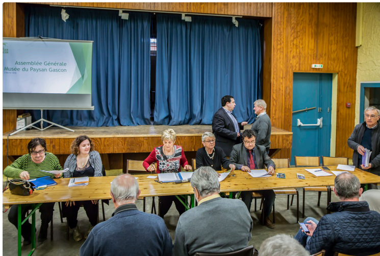
Toujouse – Musée du paysan gascon : 2017, année à oublier

Comme dans tous les sites touristiques du pays