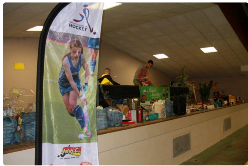
le lotto de l'IJHC