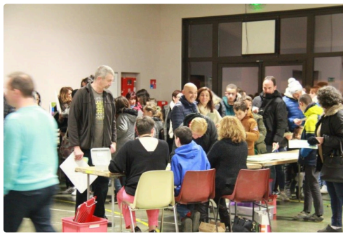
et toujours des arrivants à près de 21h00