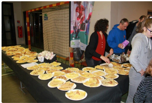
la vente des crêpes