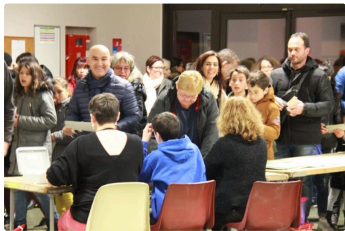
le choix des cartons et le paiement