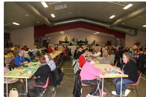
les premiers assis, prêts à gagner