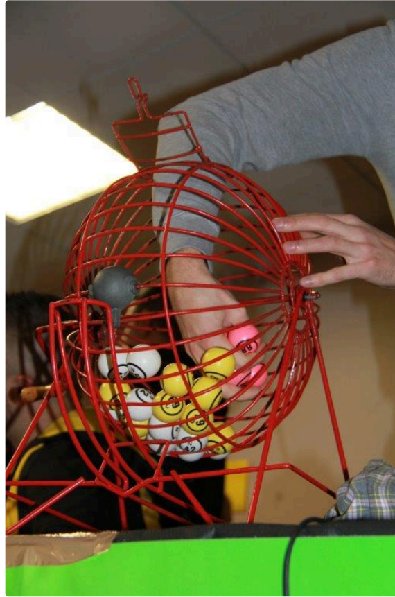
Loto du Hockey Club

Ce samedi 3 février, le club de hockey sur gazon et en salle, organisait son premier loto de l'année 2018 dans la salle "Yves Caubet". Un bingo avec mini bingo était également proposé.