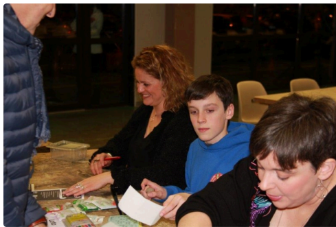
les caissières et leur aide