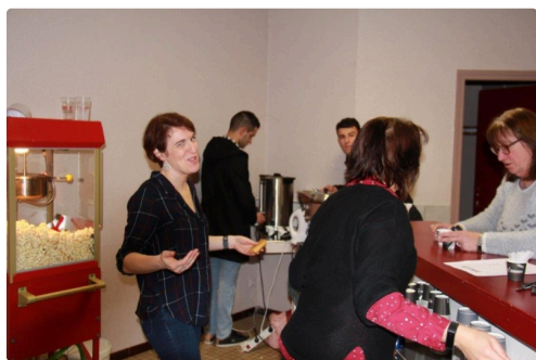
la buvette et la fabrication de pop-corn