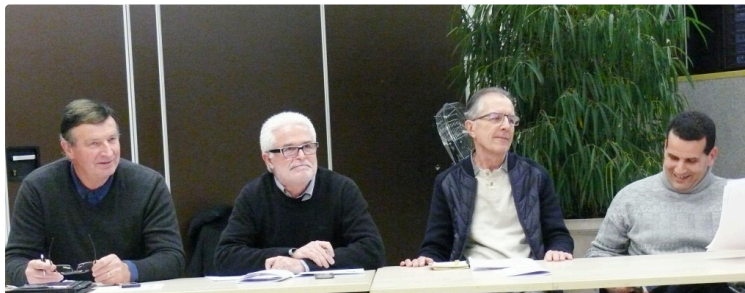
Le Comité départemental handisport a tenu son assemblée générale

Une structure qui organisera en 2018 quatre compétitions de niveau national