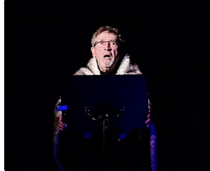
C'est mon ami qui me l'a dit !