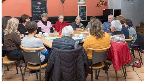
Une démarche qui porte ses fruits

Les animations d'aide aux proches de la maladie d'Alzheimer