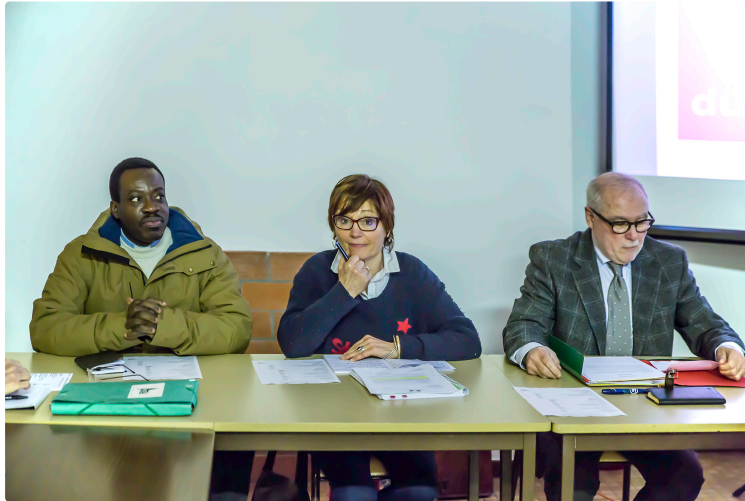
Nogaro – Année « charnière » pour Ancore

L'Association nogarolienne pour la conservation et la restauration de l'église