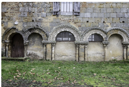
Les arcades du cloître