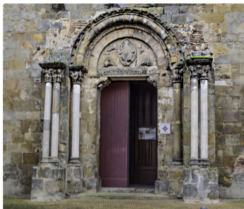
Le portail nord de l'église Saint-Nicolas; les doubles colonnes de chaque côté soutenaient un auvent