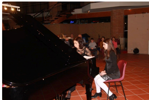
la pianiste et son aide aux partitions