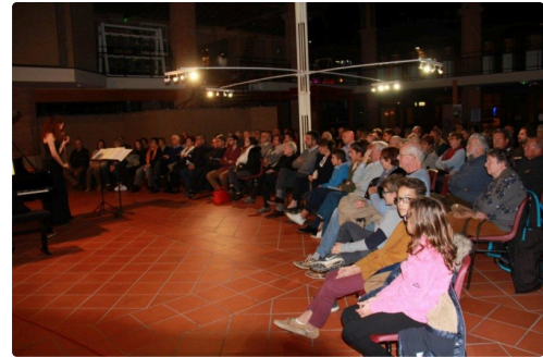
belle assistance dont des enfants