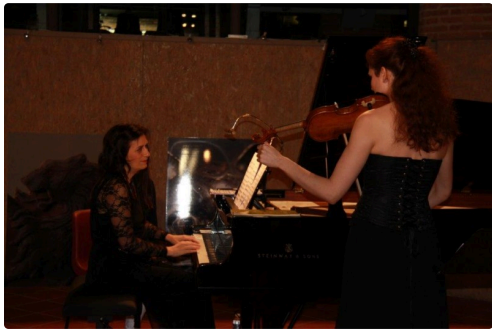
belle association pour le plaisir des auditeurs