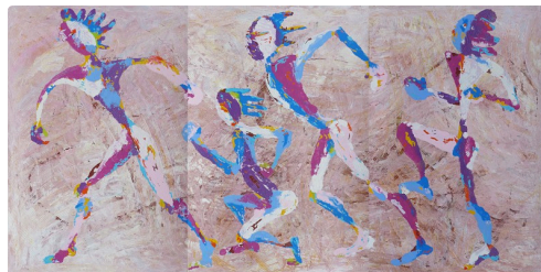
Triptyques " Coureurs"