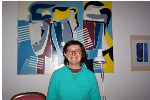
Une de ses toutes premières toiles