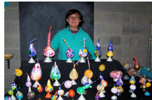
Les coloquintes n'ont plus de secret pour elle