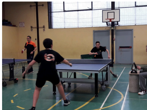
photo d'un jeune de l'équipe 5

Prochaine journée de championnat dans 15 jours. Toutes les équipes évolueront dans la salle polyvalente. Samedi 27 janvier critérium individuel à Auch.