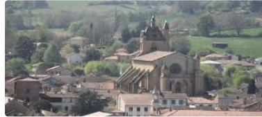
Les travaux du clocher vont bon train !