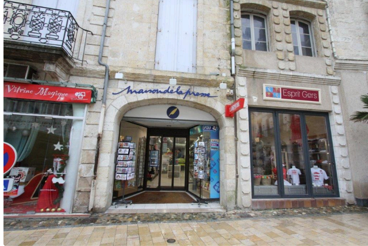
La maison de la presse en bonne place

La maison de la Presse passe de la rue Gambetta à la place St Pierre.