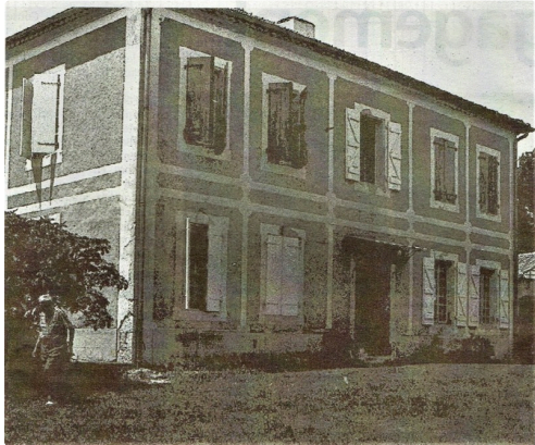
Philibert, la maison des Lacoste