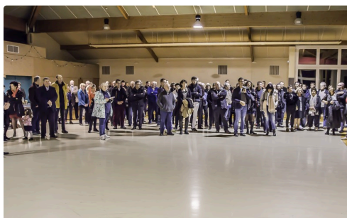
Autre vue de l'assistance