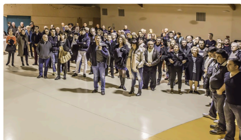
Vue d'une partie de l'assistance

(1) Voir l'article ( https://lejournaldugers.fr/article/24382-aignan-deux-nouveaux-espaces-culturels ). (2) Un projet financé à 80 % grâce aux décrets signés par Ségolène Royal pour le doublement des objectifs d'économie d'énergie d'ici 2020.