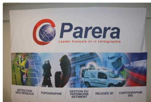
Parera leader français de la cartographie