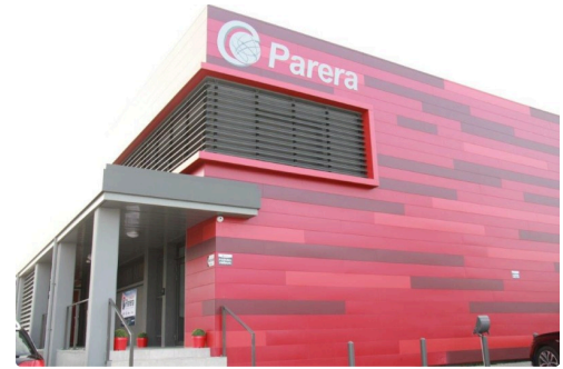
le bâtiment lillois