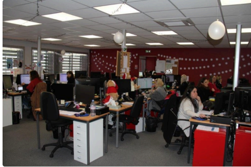
le poste phoning