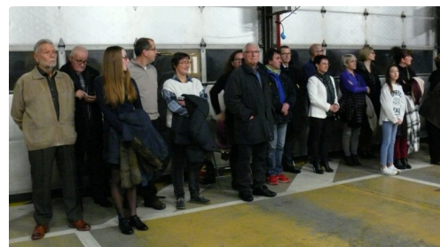
Les maires d'Auch, Lahitte, Montaut les Créneaux, Ordan-Larroque, Preignan, Castin, Duran et Tourrenquets étaient présents à la cérémonie.