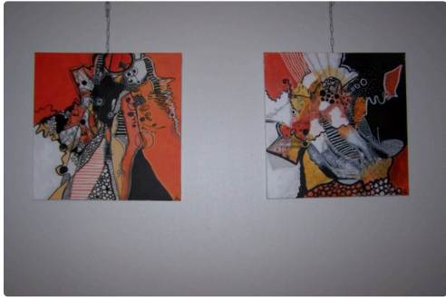
Série : " Les oranges mécaniques"

Photo : Caroline Massol devant sa toile "Tempête"