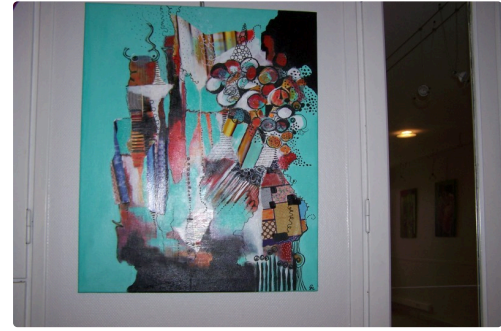
"La boîte à couture"