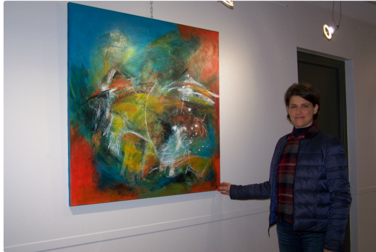
A l'Office de Tourisme : ambiance ludique et imaginaire dans le monde pictural de Caroline Massol

Une nouvelle exposition est en cours à l'Office de Tourisme de la Gascogne Toulousaine de l'Isle-Jourdain, et ce jusqu'au 31 janvier, chaque toile a son histoire, on devine que le peintre prend plaisir à les interpréter, elles sont le reflet d'une personnalité originale et chaleureuse.