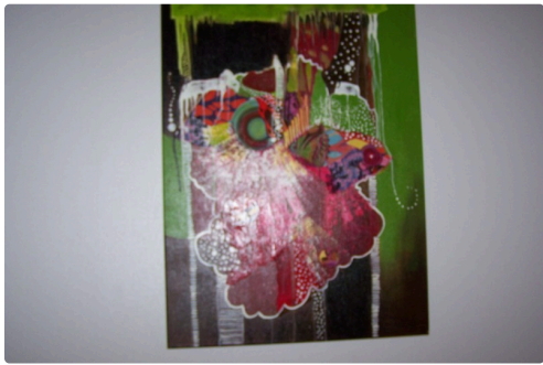
" Fête Foraine"