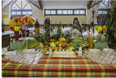
La somptueuse table de l'apéritif préparée par Les Papillons jaunes