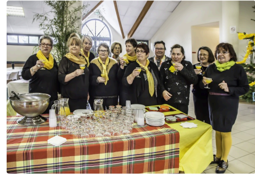
Les Papillons jaunes font les honneurs de l'apéritif