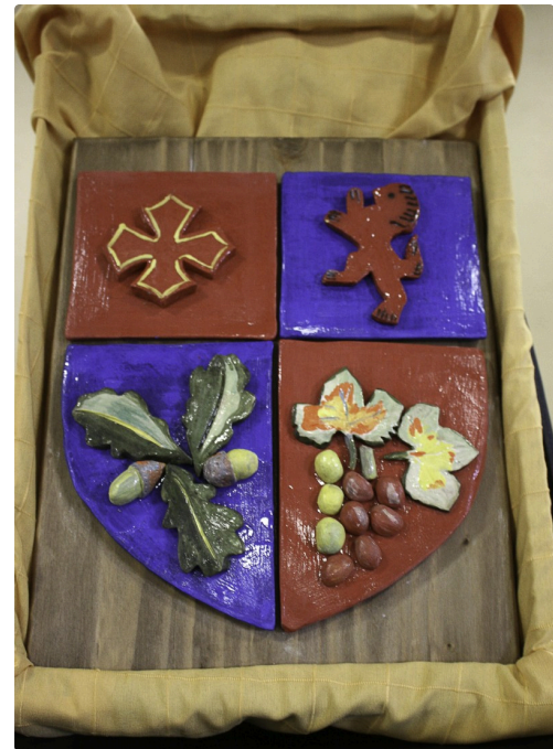
Gros plan sur le blason en dur